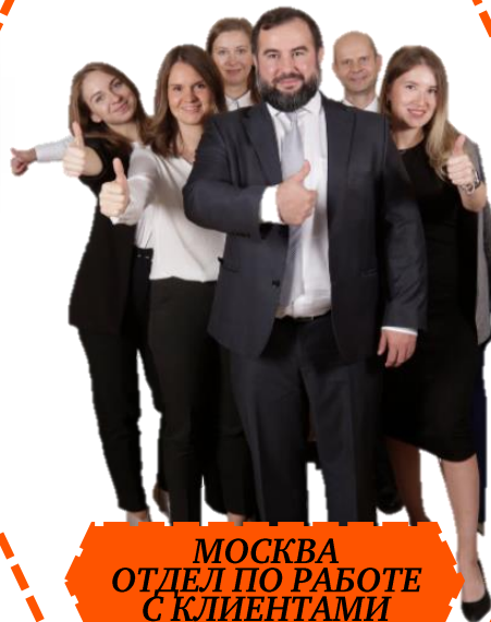
МОСКВА ОТДЕЛ ПО РАБОТЕ С КЛИЕНТАМИ