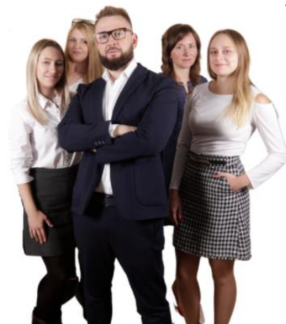
МОСКВА ОТДЕЛ ПО РАЗВИТИЮ БИЗНЕСА