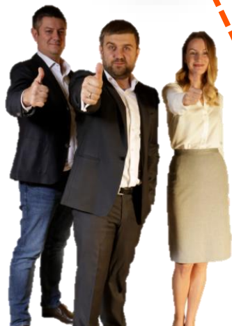
МОСКВА ОТДЕЛ ПРОДАЖ